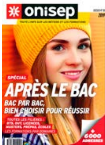
Brochure nationale Après le bac ONISEP