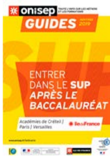
Brochure régionale Après le bac ONISEP IDF

Comment trouver sa voie parmi les multiples possibilités d'études ?