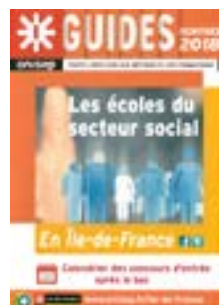
Guide Onisep Écoles du secteur social

Obtention d'un diplôme d'état ou d'un diplôme d'école