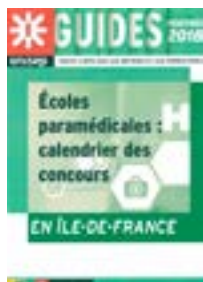
Guide Onisep Écoles paramédicales

Une spécialité professionnelle définie dès l'entrée