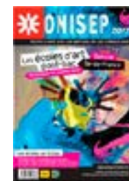
Guide Onisep Les études d'Art

Obtention d'un diplôme d'état ou d'un diplôme d'école